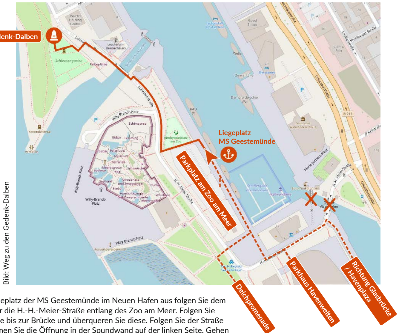
Bild: Weg zu den Gedenk-Dalben

Im Folgenden finden Sie Möglichkeiten, zu den Gedenk-Dalben zu gelangen.